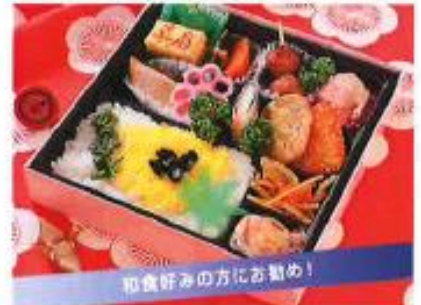
峰の雪 みねのゆき ¥1,200

ボリューム満点な和洋中食材を贅沢に盛り込 みました。見た目の華やかさと満腹感をお約 束します。