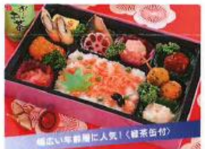
珠天箱 たまてびこ ¥1,300

祝宴に華やかな彩りを添える、凛とした貫禄の ある創作松花堂弁当。年末年始の極上のおも てなしにぴったりです。