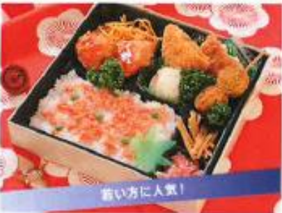
華太鼓 はなだいこ ¥1,050

あっさりとした旬食材を、寿ぎの爽やかなイメ ジで盛り込んだ和風弁当。彩りの美しさもお楽 しみいただけます。