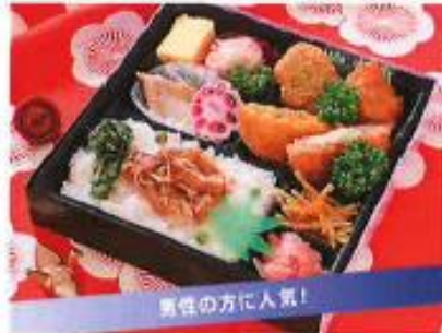
花春日 はなかすが ¥1,200

年末年始の集いによさわしい、彩りと旬の味覚が 冴えるお弁当。九ッ折1つ1つに、初春の夢が詰まっ ています。