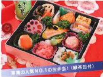
草庵の初扇 そうあんのはつおうぎ ¥1,300

年末年始の集いによさわしい、彩りと旬の味覚が 冴えるお弁当。九ッ折1つ1つに、初春の夢が詰まっ ています。