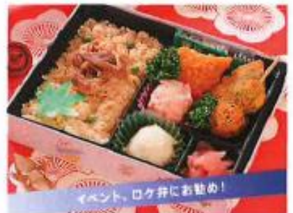
夢小箱 ゆめこびこ ¥1,000

コンパクトさの中に、ボリューム感あるご飯と個性 豊かな和洋惣菜を盛り込んだお弁当。