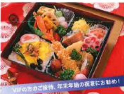
光悦 こうえつ ¥2,100

山菜あさりの佃煮をトッピングした清楚なご飯 と、あっさりとした和風惣菜をバランスよく盛り 込んだ体にやさしいお弁当。