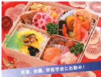
雪華抄 せっかしょう ¥1,500

味わいの異なる多種の洋風惣菜をバラエティ 豊かに盛り込みました。和風のご飯との組み合わせ も楽しめるお弁当。